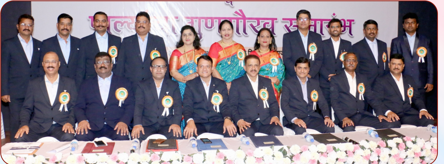
वस्तू व सेवाकर कर्मचारी सहकारी पतपेढी मर्यादित - संचालक मंडळ.