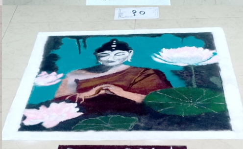
Peace of mind