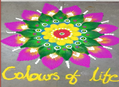
Colours of life