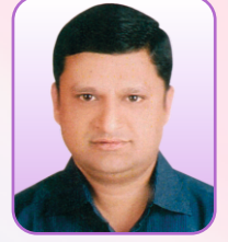
समाधान भ. सुर्वे